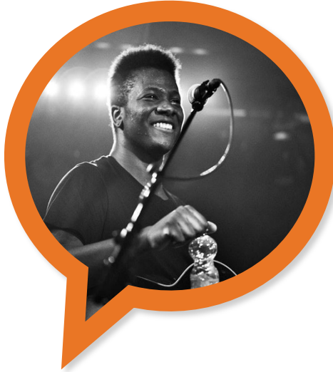
Azim Touré Singer | Songwriter | The Voice-Teilnehmer